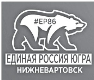
График приёма граждан в депутатском центре «ЕДИНАЯ РОССИЯ»