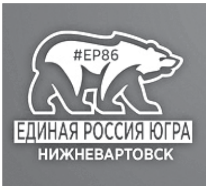
График приёма граждан в депутатском центре «ЕДИНАЯ РОССИЯ»