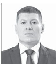
Руслан Рамисович Кушанов, депутат Думы г. Нижневартовска.