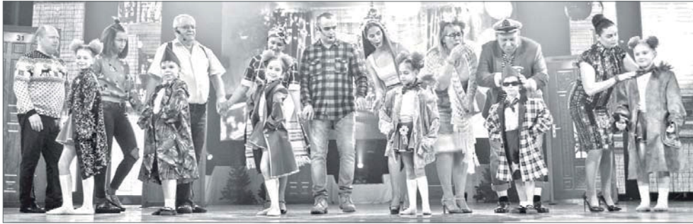
Неотъемлемая часть «Рождественских встреч» - яркая концертная программа.