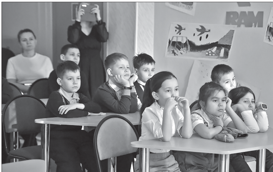
Второклассники, затаив дыхание, слушают историю подвига юного героя.

Она рассказала о мероприятиях, которые проводятся в данной школе в рамках празднования 75-летия Великой Победы. Для учащихся 2-3 классов здесь проходит смотр-конкурс военной песни. Для 1-8 классов – конкурсы стихов, посвящённых 23 февраля и 9 Мая. Обязательны акции чествования ветеранов войны с праздничным концертом и подарками, а также «Письмо солдату» и «Посылка солдату».