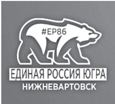
График приёма граждан в депутатском центре «ЕДИНАЯ РОССИЯ»