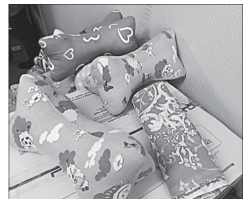
Вероника Сайтова.