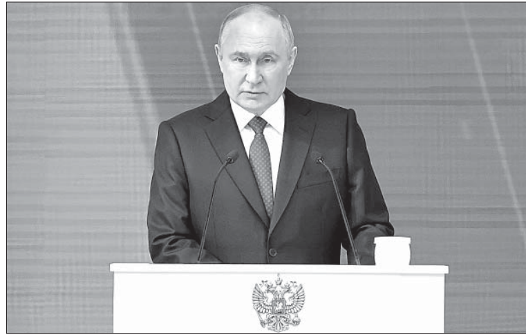
Много внимания в Послании Федеральному Собранию Президент уделил развитию регионов.

Послание Президента России Владимира Путина Федеральному Собранию – главное политическое событие в жизни нашей страны. Глава государства обозначил вектор развития страны не только на ближайшие шесть лет, но и на перспективу. Важно, что Президент РФ объявил о старте пяти новых национальных проектов.