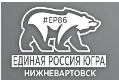
График приёма граждан в депутатском центре «ЕДИНАЯ РОССИЯ»