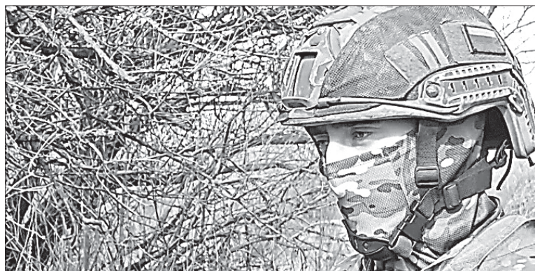
Как отмечает Рассвет, все бойцы подразделения очень вдохновились этой победой.

Командир ударно-разведывательной группы с позывным «Коловрат» рассказал, что с воздуха «Абрамс» обнаружили в тот момент, когда он заехал в населённый пункт Бердычи и пытался огрызаться в ответ на огонь наступающих российских штурмовиков.