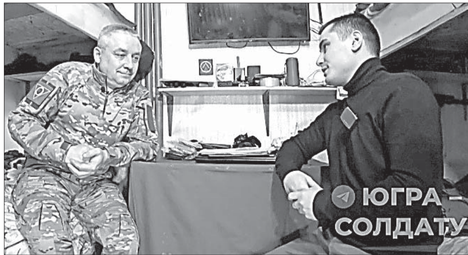
Семье о том, что уходит по контракту, сказал только тогда, когда все документы уже были подписаны.

В отпуске за полтора года службы был дважды.