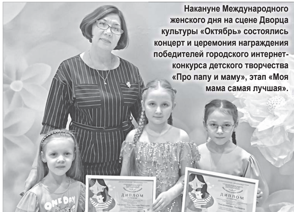
Накануне Международного женского дня на сцене Дворца культуры «Октябрь» состоялись концерт и церемония награждения победителей городского интернет-конкурса детского творчества «Про папу и маму», этап «Моя мама самая лучшая».