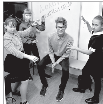
Маленькие девочки играют роль вредных привычек. Главным героем постановки должен найти в себе силы, чтобы противостоять тёмной стороне жизни.