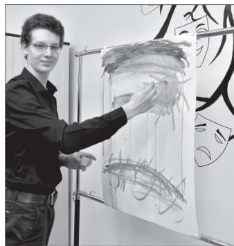
Жизнь будет такой, какой мы ее нарисуем, поэтому больше цвета и ярче краски.

Сценарий написан, распределены все роли, первый репетиционный прогон происходит буквально на наших глазах. Сюжетная линия театральной постановки основывается на контрасте цветов и эмоциональных красок - от радужной палитры к угнетающим чёрным тонам. Идеальная картина мира, которую рисует себе подросток в самом начале спектакля, сталкивается с тёмной стороной жизни - вредными привычками, давлением извне, депрессией, отсутствием взаимопонимания. Чёрный цвет начинает преобладать, и это символ внутреннего разрушения главного героя. Где искать спасения, зрителю предлагают решить самостоятельно. Театральная постановка «Долой наркоти-