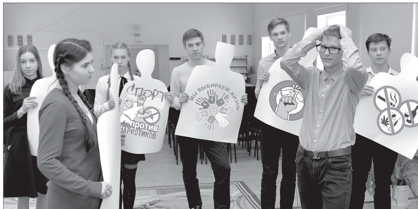
Рецепт лечения «болезни XXI века» - интерес к спорту, поддержка родителей и общение с друзьями увлечения.

Там, где печатная продукция - буклеты, листовки, уже не работает, педагоги школы №29 делают ставку на принцип «от равного к равному», негативный посыл заменив на оптимистическую мотивацию. Уже через месяц нижевартовские школьники смогут принять участие в первом городском театральном смотре-конкурсе по профилактике употребления наркотических средств и пропаганде здорового образа жизни «Мы - против наркотиков!». На чём основывается репертуарный план фестиваля и какие планы у юных артистов, отдавших предпочтение театральным подмосткам, мы решили узнать у организаторов мероприятия.