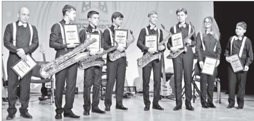
Одну победу они делают на всех, но и к мечте тоже идут все вместе. Инструментальный ансамбль «Октава» традиционно в числе фаворитов.