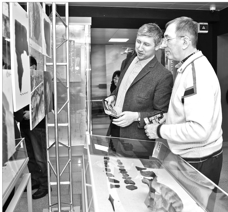
Что ни предмет – история.