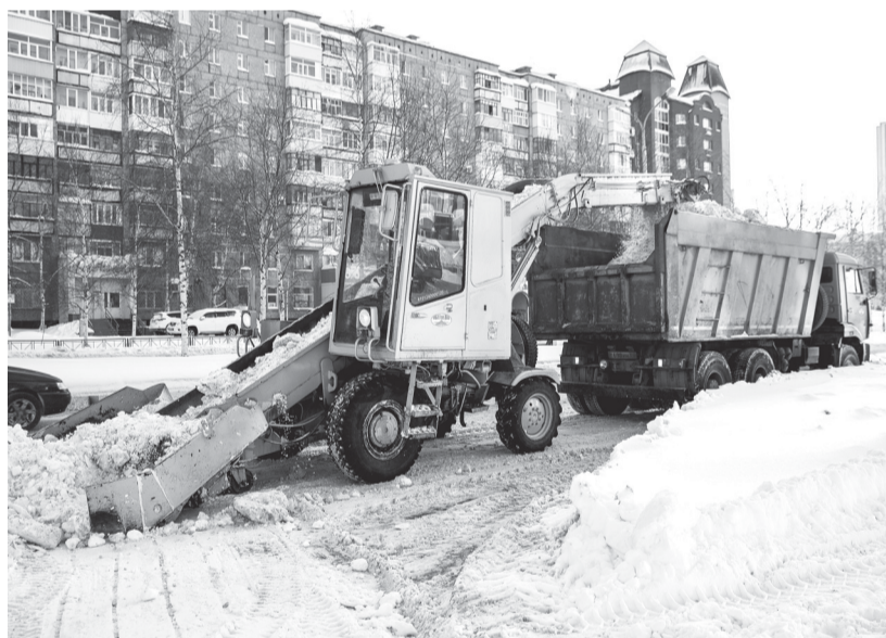
Управление муниципального контроля администрации города Нижневартовска.

Нарушение установленных правилами благоустройства территории муниципального образования автономного округа периодичности, сроков уборки территории муниципального образования автономного округа, в том числе в зимний период, а равно периодичности, сроков вывоза снега, скота льда влечёт административную ответственность, предусмотренную пунктом 1 статьи 29.1. Закона ХМАО – Югры от 11.06.2010 №102-оз «Об административных правонарушениях» и предусматривает административное наказание в виде предупреждения или наложения административного штрафа на должностных лиц в размере от трёх тысяч до десяти тысяч рублей; на юридических лиц – от десяти тысяч до пятидесяти тысяч рублей.