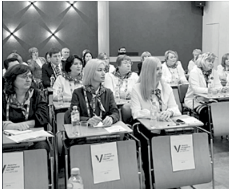
В Югре продолжается обучение участковых комиссий по проекту «Информ-УИК».

Они будут рассказывать избирателям о датах и времени