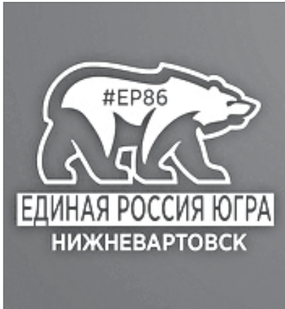
График приёма граждан в депутатском центре «ЕДИНАЯ РОССИЯ»