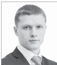
Анатолий Владимирович Лисин,