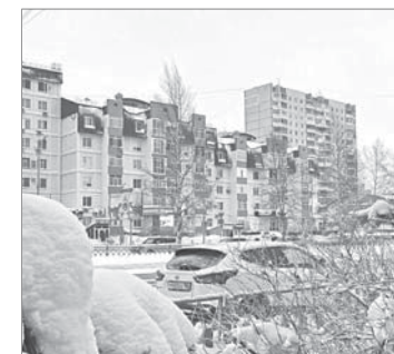
Департамент общественных коммуникаций и молодёжной политики администрации г. Нижневартовска.

На заседании комиссии также отметили, что вопросы обеспечения антитеррористической защищённости организаций социального обслуживания населения, здравоохранения, образовательных и религиозных учреждений Нижневартовска находятся на постоянном контроле.