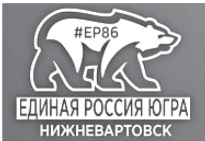
График приёма граждан в депутатском центре «ЕДИНАЯ РОССИЯ»