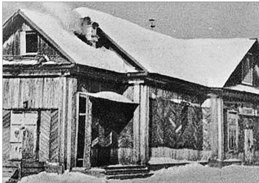
Так выглядел клуб посёлка Нижневартовского.