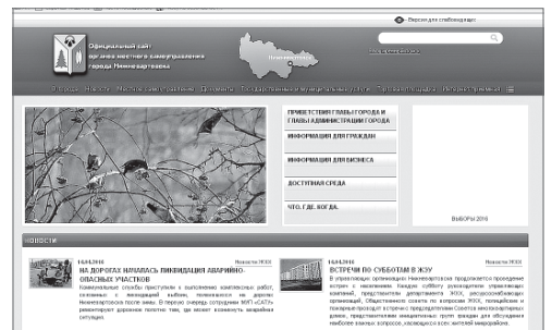
Управление по информационной политике администрации Нижневартовска. Фото Михаила Плецкого.

Отметим, что это не единственный способ получить ответы на интересующие вопросы. Также можно обратиться посредством «интернет-приёмной» на сайте органов местного самоуправления города Нижневартовска, направить письменное обращение или лично обратиться к руководителям администрации города и структурных подразделений администрации города (справочную информацию можно уточнить по телефону 24-24-34), а также во время прямого телефонного провода, который проводится ежеквартально.