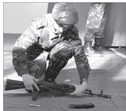
Людмила Подройкова.

нижевартовских выпускников поступили в военно-учебные заведения за последние 5 лет.