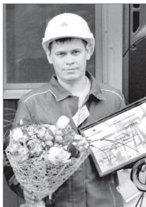
Один из лучших сварщиков Югры работает в «Варьёганнефтегазе», дочернем обществе НК «Роснефть».