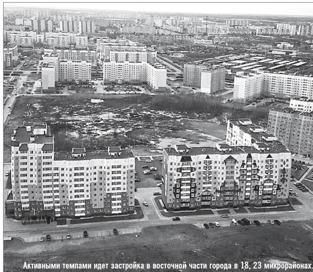
Активными темпами идет застройка в восточной части города в 18, 23 микрорайонах.

В Югре для строительства социальных учреждений разработан механизм концессионных соглашений - абсолютно новый алгоритм государственно-частного партнёрства. Данное соглашение заключается между муниципалитетом и концессионером, то есть выбираемой на конкурсной основе частной компании, на восемь лет. В этот срок входит этап проектирования будущего учреждения, строительство, а также дальнейшая техническая эксплуатация объекта. Таким образом, строителям будет выгодно строить не только качественно, но и с учётом современных энергосберегающих технологий.