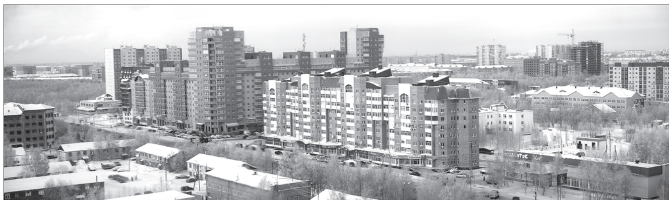
Сергей Ермолов. Инфографика Дениса Пашкова.

Указанными органами выносятся соответствующие заключения, на основании которых оформляются и выдаются справки о реабилитации; о признании лиц подвергшимися политическим репрессиям и подлежащими реабилитации; о признании пострадавшими от политических репрессий или уведомление об отказе в выдаче такой справки. Решения об отказе в выдаче справок могут быть обжалованы в судебном порядке.