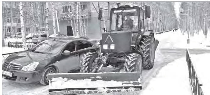
Арина Арсеньева.

Это рекордный показатель в этом сезоне. Причина - двойная норма выпавших осадков.