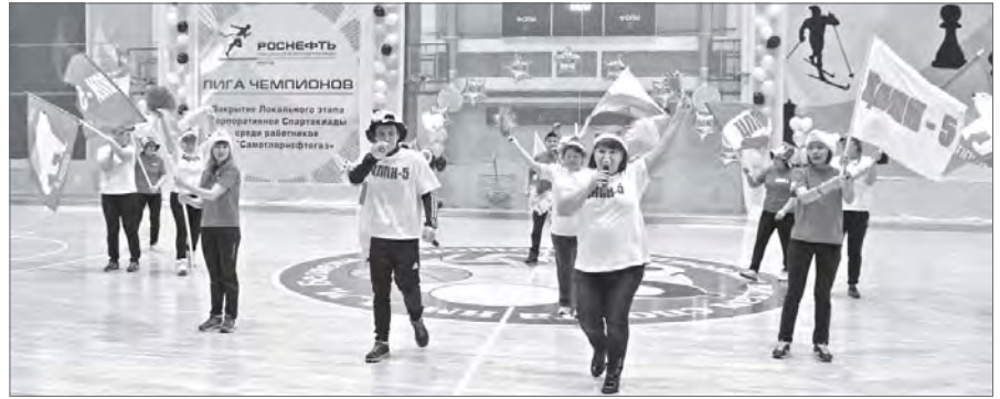
Конкурс болельщиков. Команда ЦППН-5.

Нефтяники АО «Самотлорнефтегаз», дочернего общества компании «Роснефть», встречаются друг с другом не только на производственных площадках, но и на спортивных. Традиционно на предприятии проходит спартакиада среди цехов и подразделений по девяти видам спорта. Закрытие и подведению итогов состязаний был посвящён спортивный праздник «Лига чемпионов».