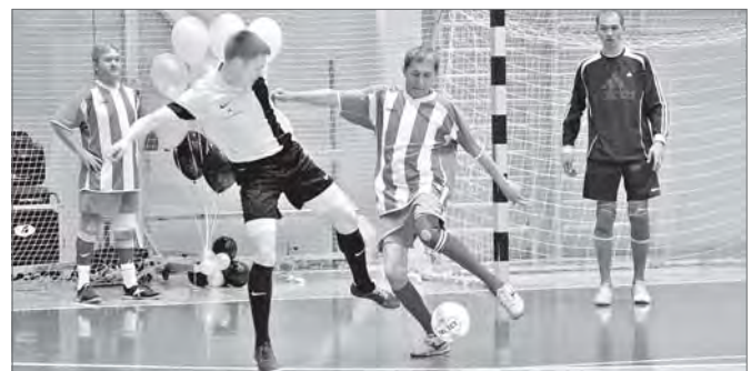
Футбольные баталии нефтяников.