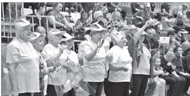
Команда Совета ветеранов «Болела» горячее всех.