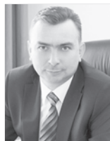
Максим Клец, глава города.

Сегодня в составе хора 40 участников в возрасте от 26 до 70 лет. Начиная с 2005 года «Сибирские зори» - активный участник и победитель множества городских, региональных, межрегиональных фестивалей и конкурсов русской и народной песни.