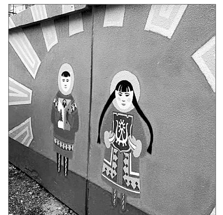
Департамент общественных коммуникаций администрации города Нижневартовска.

За реализацией молодёжных креативных проектов можно следить на сайте органов местного самоуправления по хештегам #МолодёжьНВ #ЯрчеГород2020 и на страницах нижневартовского Молодёжного центра в VK и Инстаграм.