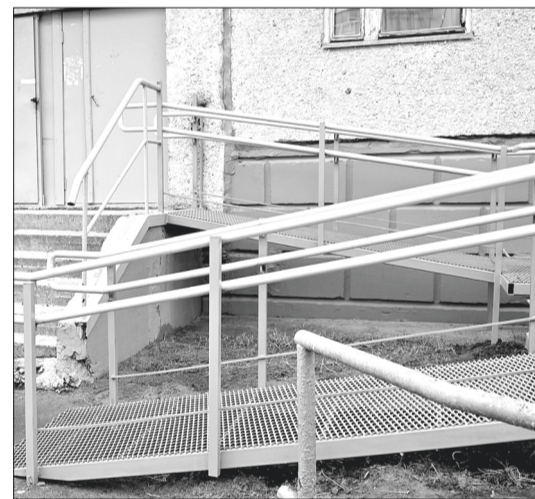
Новым пандусом воспользуются и мамы с колясками.