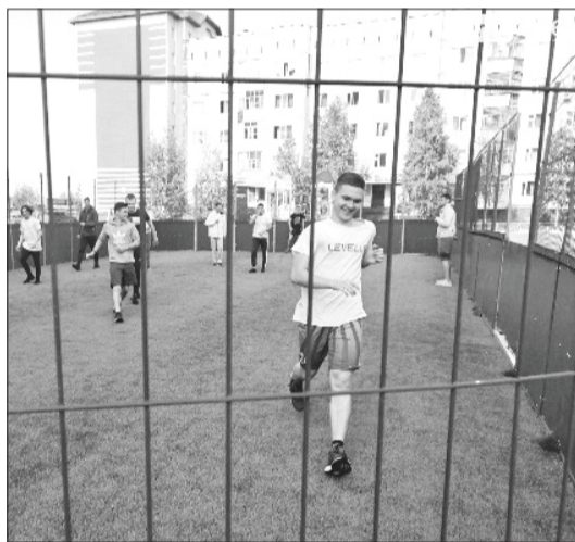
Спортивная площадка после реконструкции.