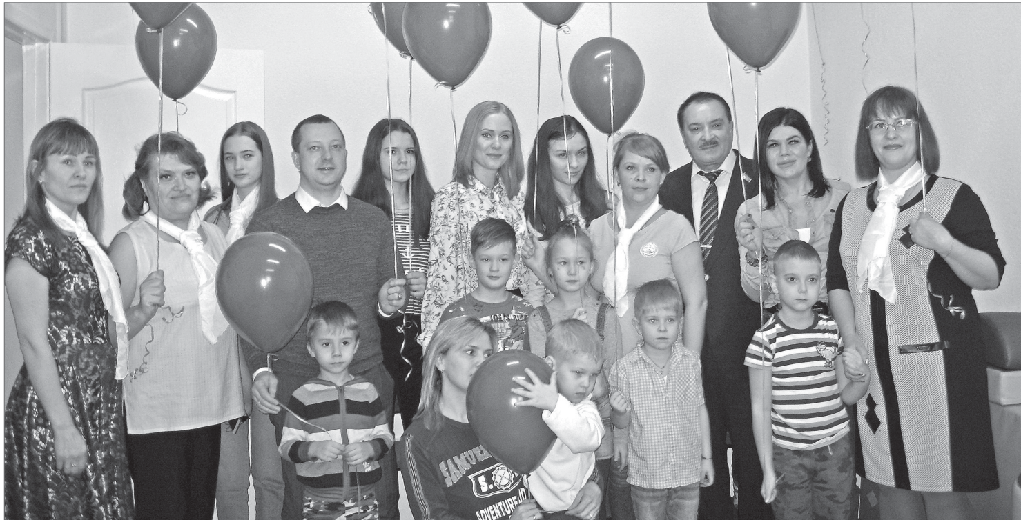
Зажём Нижневартовск синим!