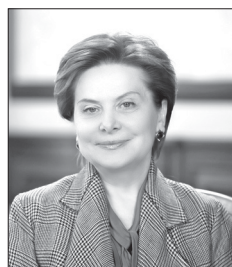
Наталья Комарова, губернатор Югры:

— Уже несколько лет из федерального бюджета финансируются региональные программы по сносу аварийного жилья. Мне поступило решение Фонда содействия развитию ЖКХ о принятии нашей заявки для участия в национальном проекте, определён объём софинансирования. В ней указан каждый конкретный дом в каждом муниципалитете. Обеспечение людей жильём, в том числе проживающих в аварийном жилом фонде, — это компетенция органов местного самоуправления. И эта программа — одна из редких, где указаны адреса каждого аварийного дома в привязке к конкретному муниципалитету. Мы все в одной команде, поэтому очень важно понимать друг друга и должным образом реагировать на запросы югорчан.