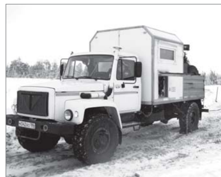
Дарья Новикова.

трубопроводов, протяжённостью более 57 км.