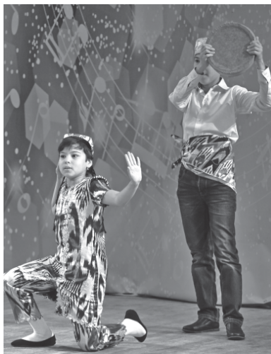
Подготовила Юлия Насонова.

Конкурсные просмотры состоятся 26 и 27 сентября в 16.00. Лучшие номера участников войдут в гала-концерт фестиваля «Шаг навстречу».