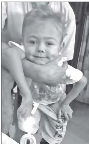
Вопрошающий взгляд надежды маленького вартовчанина не остался без ответа юных земляков.

В Детской школе искусств №1 состоялся благотворительный концерт «Музыка и живопись». Мероприятие филармонии ДШИ №1 «Музыкальная палитра» состоялось в рамках проекта «Дети - детям» совместно с региональным благотворительным фондом «Лучик света».