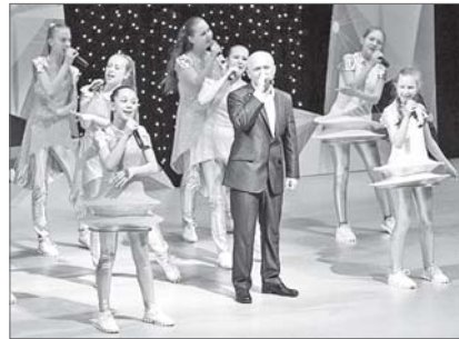
Благотворительный концерт «Альберт, ты будешь жить!»

- Оказалось, столько людей меня знают и переживают за меня, - говорит юноша.