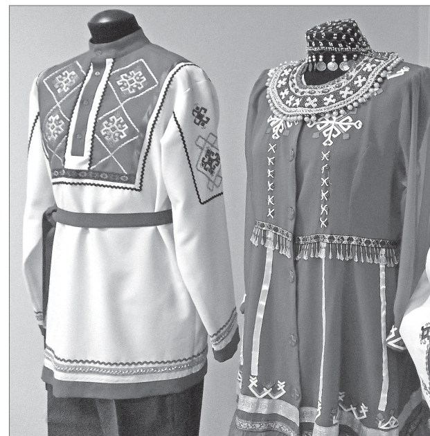
Вместо цветов на костюмах пиктограммы, которые рассказывают о родословной владельца.

Отмечу, что выставка чувашской литературы будет работать в библиотеке №5 (ул. Интернациональная, 35-а) до конца февраля. Так что всегда можно выбрать время, чтобы поближе познакомиться и с книгами чувашских писателей, и с выставкой мастериц «Илема».