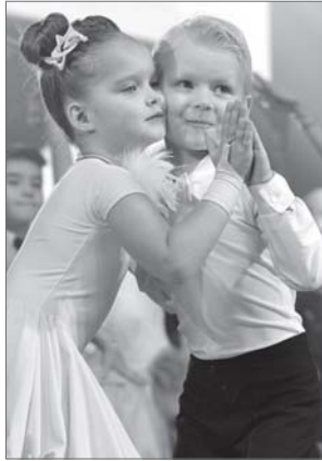
В развитие талантов юных нижевартовцев вложен труд каждого работника культуры города.