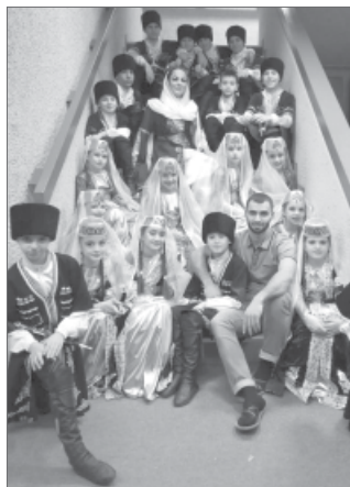
Школа кавказских танцев «Асса».