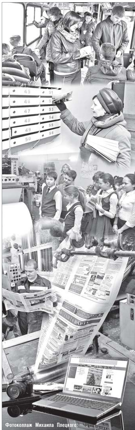
Фотоколлаж Михаила Плецкого.