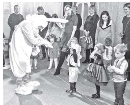
Малыши учили Зайку танцевать, а ребята постарше «зажгли» на балу у Снежной королевы.

посвящает себя строительству карьеры, осознают, как важно детям чувствовать родительское внимание.