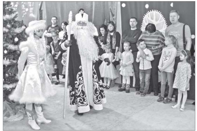
Без сказочного волшебника праздник не наступит.

Преображение в эти дни ждёт и родителей: обычно занятые мамы и папы получают шанс забыть о делах, окунуться в атмосферу чудес, метаморфоз и искрящегося детского смеха. Те, кто большую часть своего времени проводит на работе,