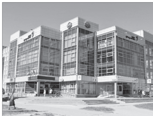
Многофункциональный центр в Нижневартовске.

Сегодня multifunctional центры сопровождают югорчан в важных и значимых моментах жизни. Первый паспорт, свадьба, рождение ребёнка, своё дело или новый дом. При этом важно, чтобы все эти услуги предоставлялись быстро и в комфортных условиях. Эта задача решена во многом благодаря программе «Сотрудничество». По ней построены здания МФЦ в половине муниципалитетов Югры. Например, в Сургутском районе построено три МФЦ: в Лянторе, центр для Сургутского района в Сургуте и комплекс в посёлке Белый Яр. Великолепное здание МФЦ недавно открылось и в Излучинске Нижневартовского района.