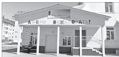
Детский сад «Светофорчик» в Нижневартовске.

Комплекс площадью более 18 тысяч квадратных метров включает в себя блоки для начальных и старших классов, спортивный зал, просторную столовую, бассейн. В новой школе также есть большой актовый зал почти на 400 зрителей, библиотека с читальным залом и книгохранилищем. Всего на возведение комплекса ушло около 2 лет. Важный образовательный объект для окружной столицы был сдан в эксплуатацию задолго до наступления намеченного срока. И это несомненный успех.