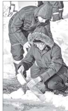
Православные верят, что крещенская вода заряжена молитвенным словом, а значит, святая.