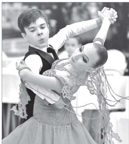
В танце, как в жизни: игра на чувствах.