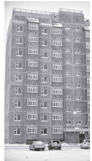
Доходный дом скоро примет первых новоселов.

Первоначально заселение планировалось на осень 2019 года. Однако главой города принято решение приурочить новоселье к первому весеннему празднику – 8 Марта. И 15 семей уже готовы въехать в новые квартиры.