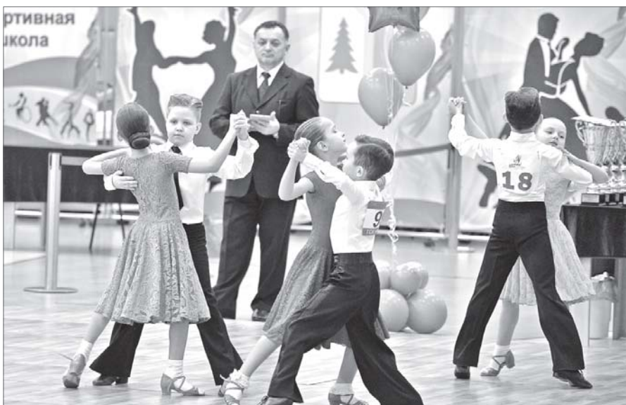
Строгий и беспристрастный оценочный взгляд судей в младшей возрастной категории танцоров от 7 до 11 лет.