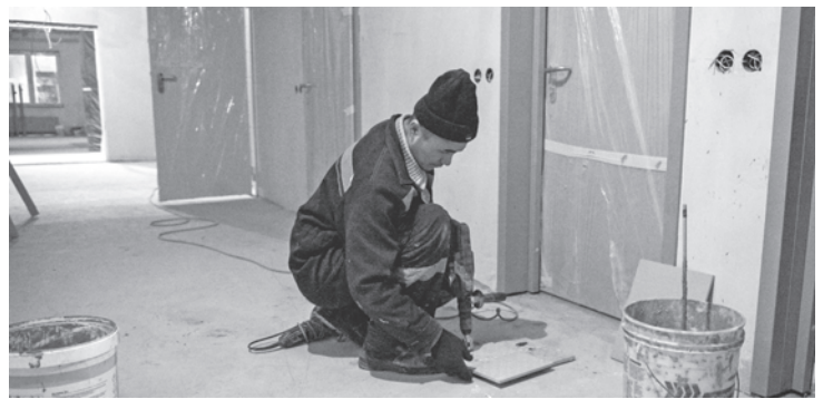
Только высококачественные строительные материалы!

Сдача в эксплуатацию больницы запланирована на 2020 год. Она станет крупнейшей в городе и округе: будет состоять из четырёх медицинских корпусов, одного инфекционного корпуса, хозяйственного блока и гаража. Здесь будут работать отделения разных профилей – терапия, онкология, кардиология, нейрохирургия, пульмонология и другие.