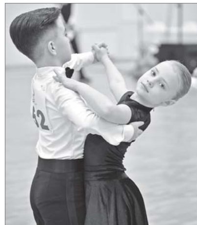
Чувство поддержки - главное качество для партнера.

Всего приняло участие 275 пар: из Томской области - клуб «Сerpантин» (г.Стрежевой), из ХМАО - Югра: «Best», «Весна», «Фiesta» (г.Нижневартовск), «Виктория» и «Возрождение» (г.Сургут), «Нюанс» (г.Мегион), «Элеон» (г.Ханты-Мансийск), «Юность» (г.Нефтеюганск), и также из ЯНАО клуб «Браво» (г.Ноябрьск).