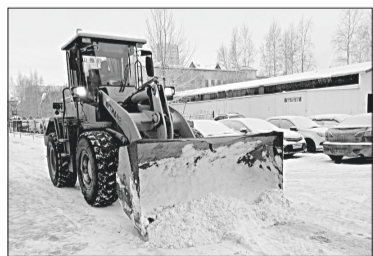
Департамент общественных коммуникаций и молодёжной политики администрации г. Нижевартовска.

Очистка ведётся не только на центральных улицах, но и на участках, ведущих к садовым товариществам (СОТ «Буровик», «Берёза», «Рубин»).