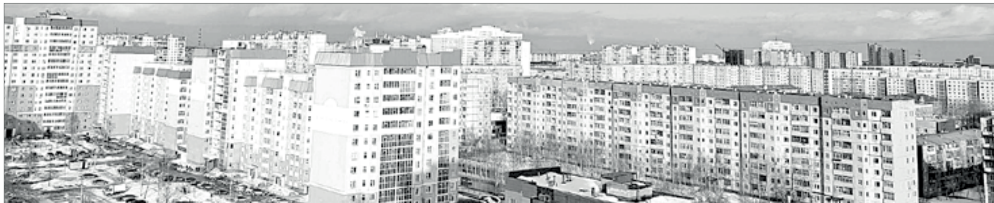
Материалы департамента муниципальной собственности и земельных ресурсов администрации города.

Телефоны специалистов департамента: 43-71-42, 43-59-88, 29-11-85.