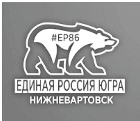
График приёма граждан в депутатском центре «ЕДИНАЯ РОССИЯ»