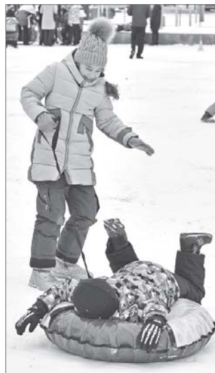
«А теперь ты меня прокати!»