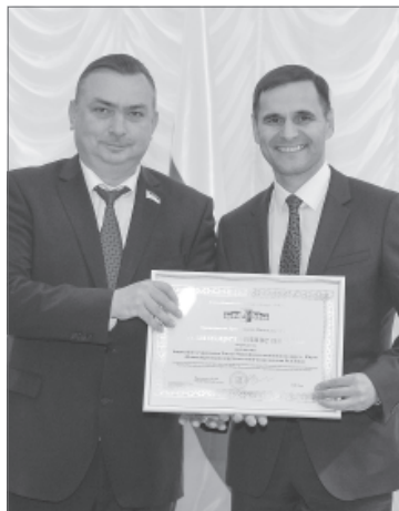
За многолетний добросовестный труд коллектив медицинского учреждения был отмечен благодарственным письмом Думы города Нижневартовска.