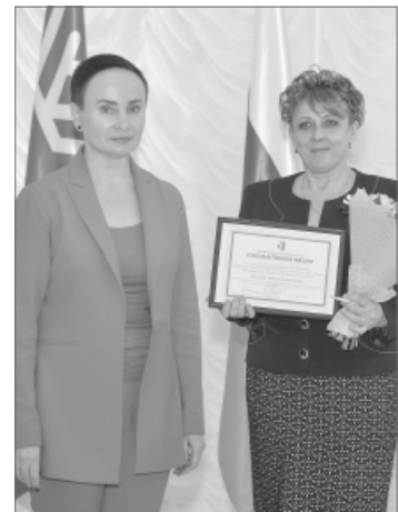
Специалисты БУ «Нижневартовская окружная клиническая детская больница» получили знаки отличия, дипломы и грамоты федерального, окружного и городского уровней.