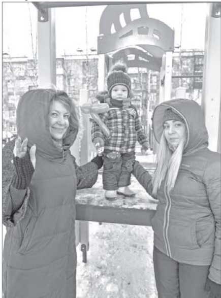
Кто тут самый высокий?

Ноябрьские торжества вартовчан накануне Дня народного единства начались прямо во дворах. Сразу в двух точках города: во втором микрорайоне и на Рябиновом бульваре прошли большие семейные праздники.