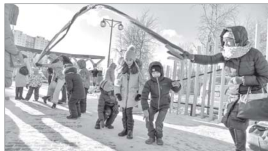
Так забавлялись наши предки!

...Рыжая осень постепенно уступает место стальной зиме. Но здесь всё вокруг словно согрето рябиновым дыханием. Тепло от апельсиновых оттенков жилых домов вокруг, разноцветной листвы, проглядывающей сквозь свежее выпавший снег, и от улыбок соседей, что собрались сегодня вместе, чтобы познакомиться и дружить.