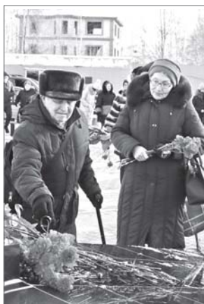
К памятнику горожане принесли цветы.