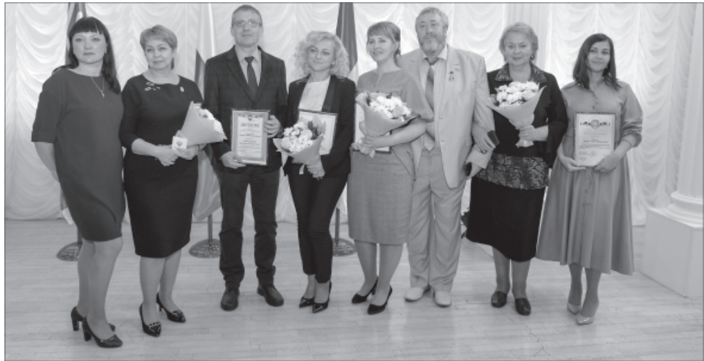
Все достижения медучреждения - это заслуги большого и дружного коллектива.

Это учреждение занимает лидирующие позиции по качеству медицинских услуг и по объёму оказываемой помощи. Сюда привозят маленьких пациентов со всего округа и самые страшные диагнозы. В 2018 году исполняется 15 лет Нижневартовской окружной клинической детской больницы. В рамках праздничных мероприятий во Дворце искусств прошла церемония награждения ангелов в белых халатах, а наряду с поздравлениями специалисты медучреждения получили знаки отличия, дипломы и грамоты федерального, окружного и городского уровней.