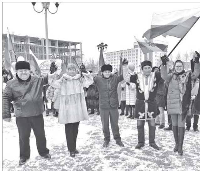
Хороший день для того, чтобы увидеть, как нас много и улыбнуться друг другу.

- Я этому очень рад, ведь мы уникальный народ. Мы живём в многонациональной стране, где столько разных культур, и живём дружно, уважая друг друга. Представьте себе, мы отмечаем событие, которое произошло четыре столетия назад! Потому что время идёт, но мы - это по-прежнему мы. И ничто нам не страшно, пока мы вместе.