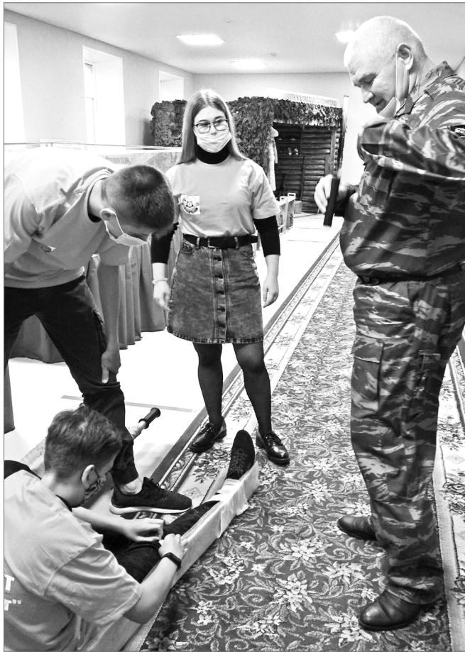
Транспортировка раненого – особая наука.

Мы привыкли отмечать День Победы 9 мая, когда закончилась Великая Отечественная война. Но Вторая мировая война продолжалась – до сентября шли бои на Дальнем Востоке, гибли, уничтожая врага, наши соотечественники.