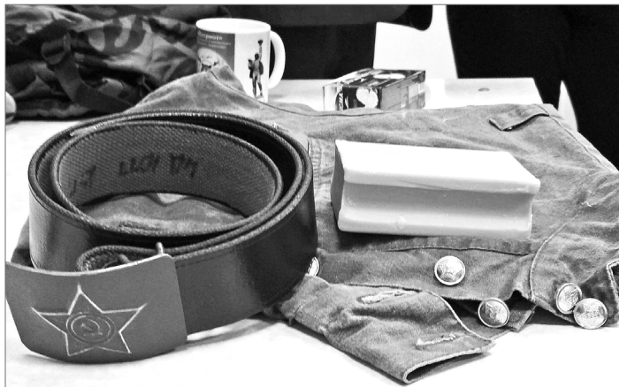
Что положить в вещевой мешок?

После подсчёта всех баллов оказалось, что победила «Дружба». Так назвали свою команду школьники, которые занимаются в «Патриоте» спортивной радиопеленгацией. Впрочем, проигравших не было. Каждый в этом квесте что-то приобрёл – новые знания, навыки, командный дух, понимание, что такое чувство локтя и над чем нужно ещё поработать, – всё пригодится.