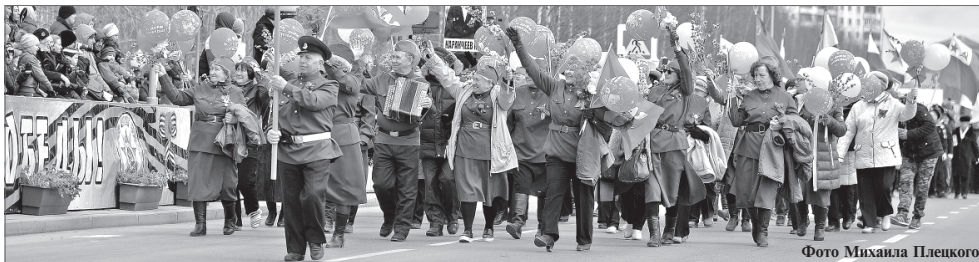
Фото Михаила Плещого.

Департамент экономики администрации Нижневартовска.