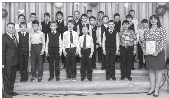
Лучшие на льду – лучшие в учебе. 3-в класс школы №2.