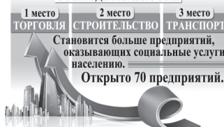
Инфографика Дениса Пашкова.