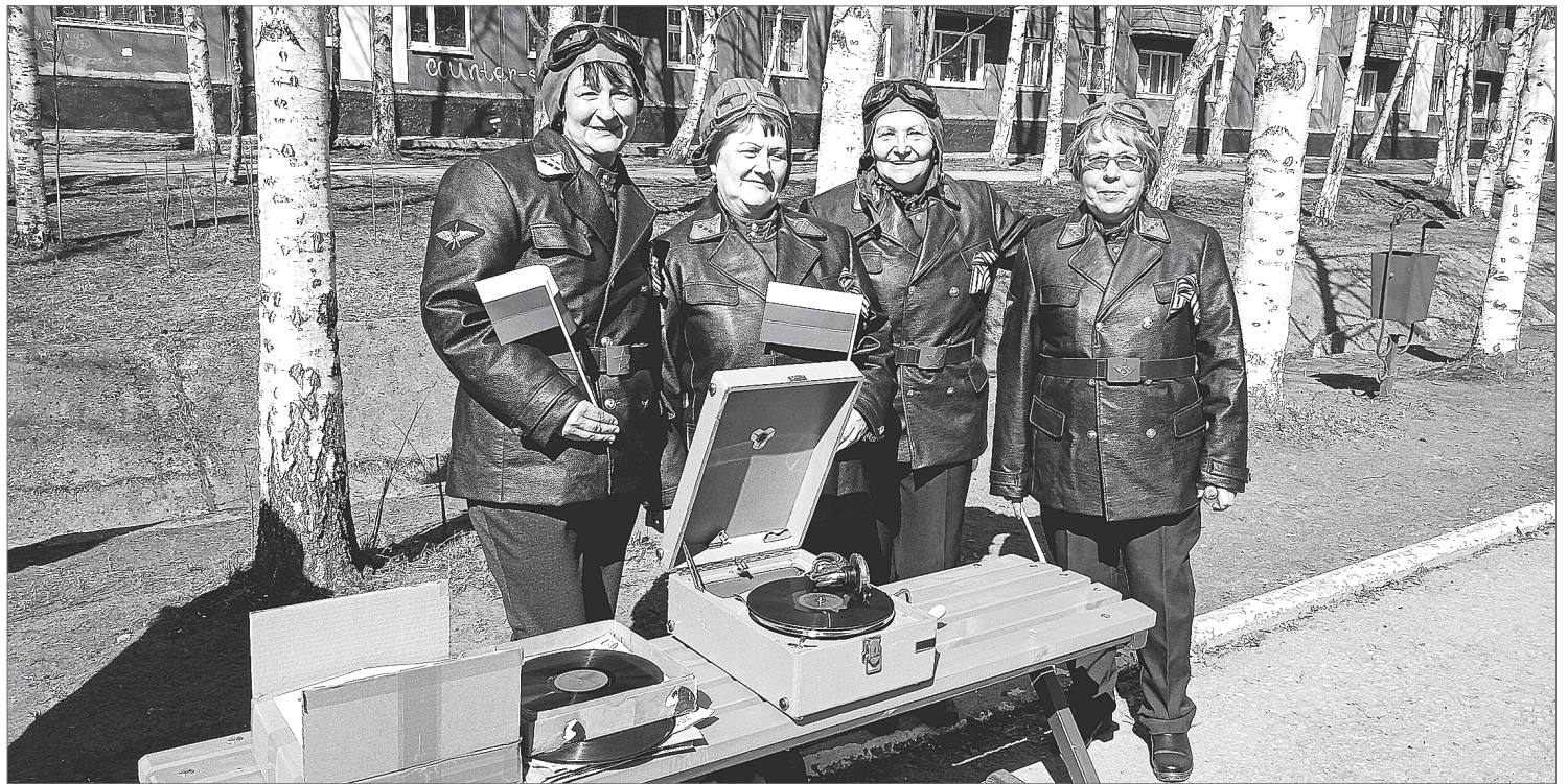
Довоенный патефон 1935 года. Под его звуки отплясывали ветераны, с раритетным артефактом спешили фотографироваться вартовчане.

Этот малоприметный чемоданчик уютно расположился в самом сердце парка Победы. В разгар праздника случайные прохожие даже взгляд на нём не задерживали, спеша по своим делам, увлечённые своими заботами. И только он – симпатичный паренёк, студент Нижневартковского нефтяного техникума, с особым чувством и любовью протирает его бока, открывая и придирчиво оглядывая содержимое коробки.