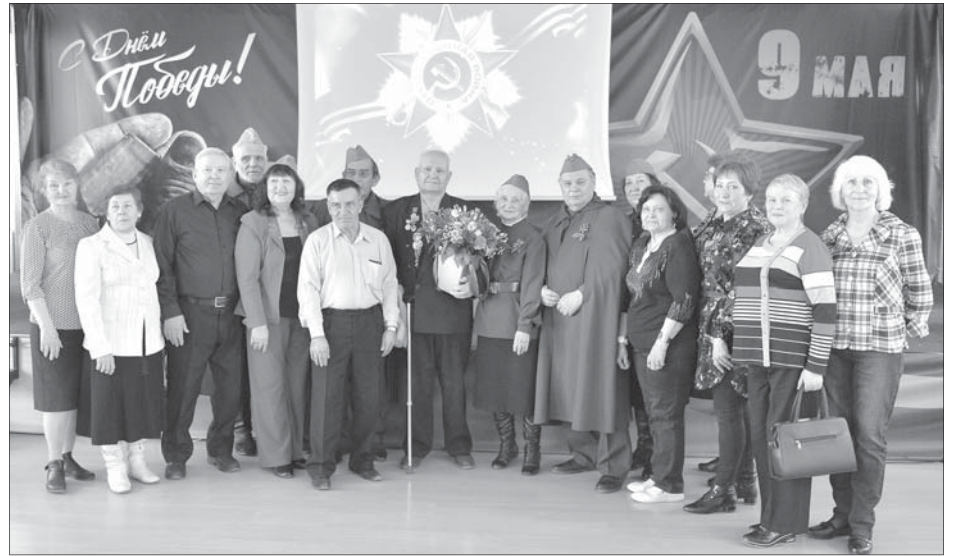
День Победы – это радость со слезами на глазах.