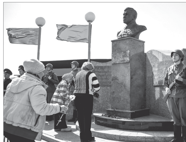
8 мая несли цветы также к памятнику поэту и участнику Великой Отечественной войны Мусе Джалилю.

Накануне празднования Дня Победы перед памятником воинам-землякам прошёл традиционный ежегодный митинг в память о тех, кто отдал свои жизни в годы Великой Отечественной войны.