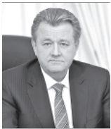
Василий Тихонов, глава города Нижневартовска.