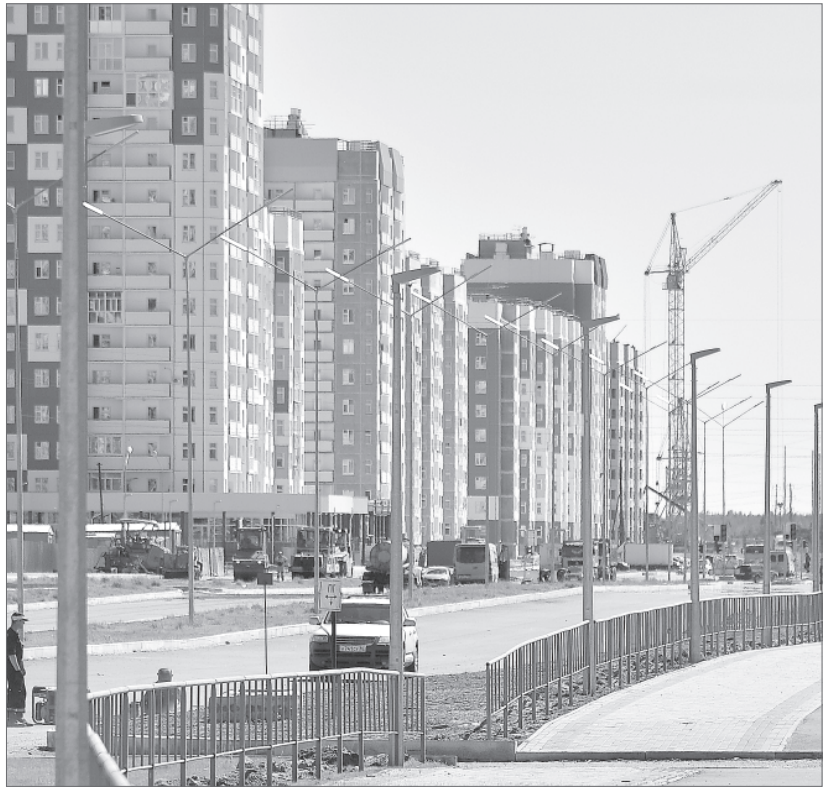
Более 200 млн рублей потрачено на строительство первого отрезка дороги. К Дню строителя ее планируют запустить в эксплуатацию, что разгрузит плотный поток автотранспорта, ведущий в новые микрорайоны. Подробнее о благоустройстве городского пространства читайте на стр. 4 сегодняшнего выпуска «Варты».

В нашем городе всё должно быть прекрасно: дворы и дороги, остановочные павильоны и фасады зданий. Таковы указы вартовчан городской власти. Лето - самая горячая пора для строительства и благоустройства. Этот важный вопрос находится под пристальным вниманием главы города Василия Тихонова. Каждую неделю он инспектирует все новые объекты. Улица Ленина. Когда-то заболоченная восточная её территория превращается на глазах горожан в современную автомагистраль.