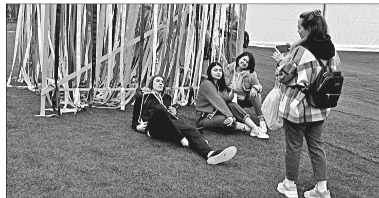
В фотозоне было оживлённо.

Завершился молодёжный экофорум рок-концертом и флэш-мобом. С мероприятия ребята увозили подарки, яркие впечатления и хорошее настроение.