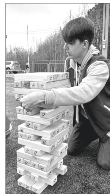
Построить устойчивое будущее можно только на чистой планете.