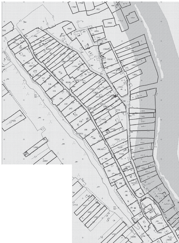
Схема границ зон с особыми условиями использования территории