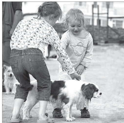
Уважаемые жители города!

Уважаемые родители! Эти правила следует объяснить детям во избежание несчастных случаев.