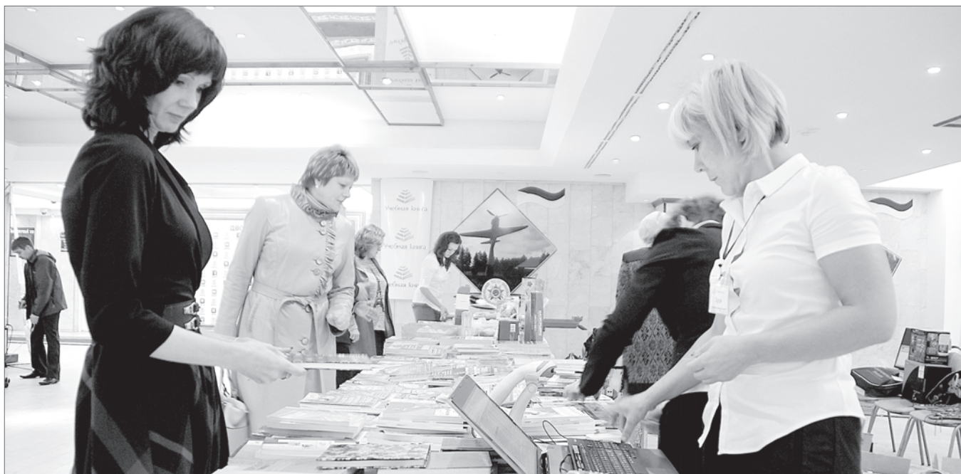
Развитие образования начинается с развития педагога.