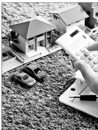
БУ ХМАО – Югры «Центр имущественных отношений».