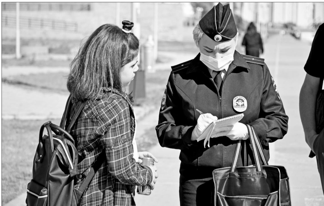
За нарушение режима самоизоляции и детей, и родителей ждёт административное наказание.

Для вчерашних школьников солнце, воздух и вода – слагаемые весёлых каникул и приятного времяпрепровождения. Как только ветер разгоняет тучи, большинство ребят втайне от родителей устремляется поближе к водоёмам: позагорать, поиграть с друзьями, искупаться. Такой бесконтрольный отдых может дорого стоить, вот почему вопросам безопасности детей и подростков в летний период уделяется особое внимание. Чтобы предотвратить несчастные случаи на воде, в ежедневные рейды выходят специалисты управления по делам ГО и ЧС. В этот раз компанию спасателям составили представители администрации города, комиссии по делам несовершеннолетних и УМВД по городу Нижневартовску.