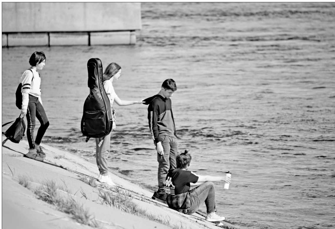
Бесконтрольный отдых у воды может обернуться трагедией.

под видом безмятежности таит в себе множество угроз – от неровного дна и паразитов до водоворотов и скоростного течения. По опыту могу сказать, что чаще всего человек тонет не оттого, что не умеет плавать, а потому, что поддаётся панике или попросту недооценивает место, выбранное для купания.