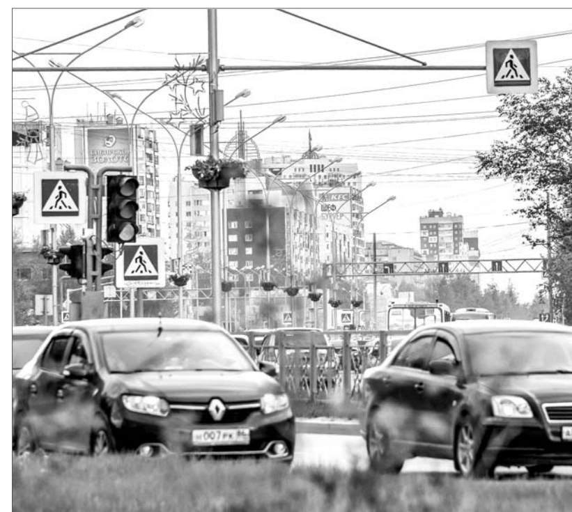
Пресс-служба прокуратуры ХМАО – Югры. Фото Игоря Жданова.

По результатам состоявшейся коллегии приняты меры, направленные на усиление надзора в сфере соблюдения законодательства о безопасности дорожного движения и повышения его результативности.