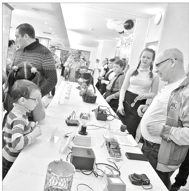
На выставке легко понять, к какому занятию ребёнок склонен.

В Нижневартовске на один календарный год выделено: 20117 сертификатов, что составляет 45% от общего числа детей, проживающих в нашем городе, в возрасте от 5 до 18 лет. 4000 рублей – номинал одного сертификата.