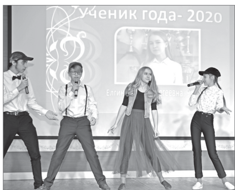
Торжество ума, трудолюбия и творчества.