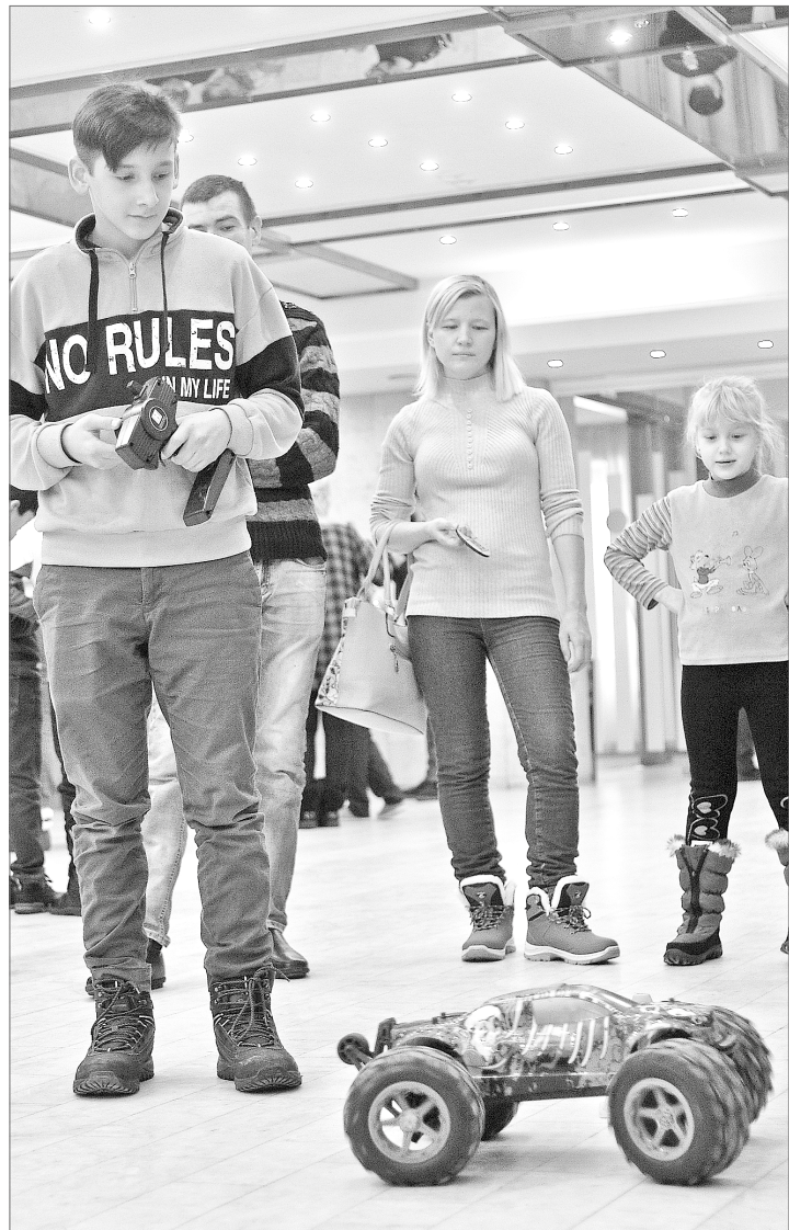
Создать автомобиль мечты можно уже сейчас. Этому учат в Центре детского и юношеского технического творчества «Патриот».

В Нижневартовске на один календарный год выделено: 20117 сертификатов, что составляет 45% от общего числа детей, проживающих в нашем городе, в возрасте от 5 до 18 лет. 4000 рублей – номинал одного сертификата.