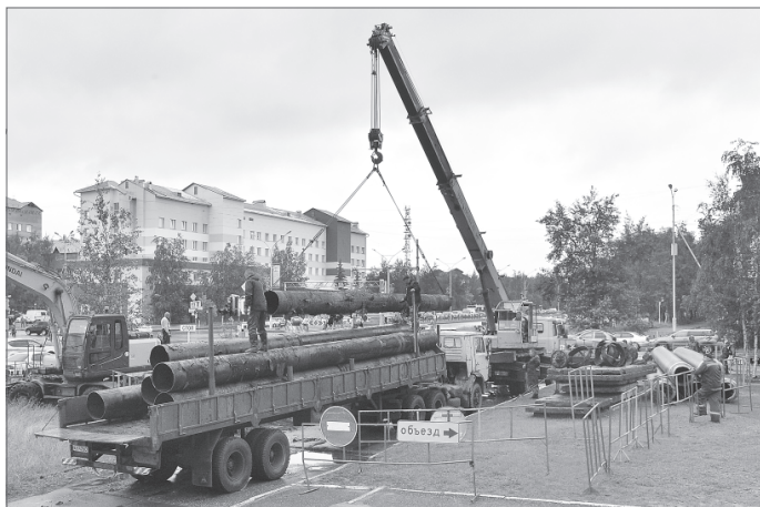
Ремонтные работы по замене теплосетей на перекрёстке улиц Ленина и Нефтяников.

Несмотря на то, что на календаре лето, коммунальщики Нижневартовска ведут активную подготовку к зиме. Большой комплекс обязательных работ важно и нужно провести в короткие сроки, качественно и без нареканий. Неудобства, связанные с заменой коммуникаций на центральных улицах города, недовольства у вартовчан не вызывают. В свою очередь специалисты МУП «Теплоснабжение» отмечают, что до наступления холодов им предстоит уложить более семи километров новых труб.