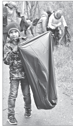
На субботник вышли даже дети.