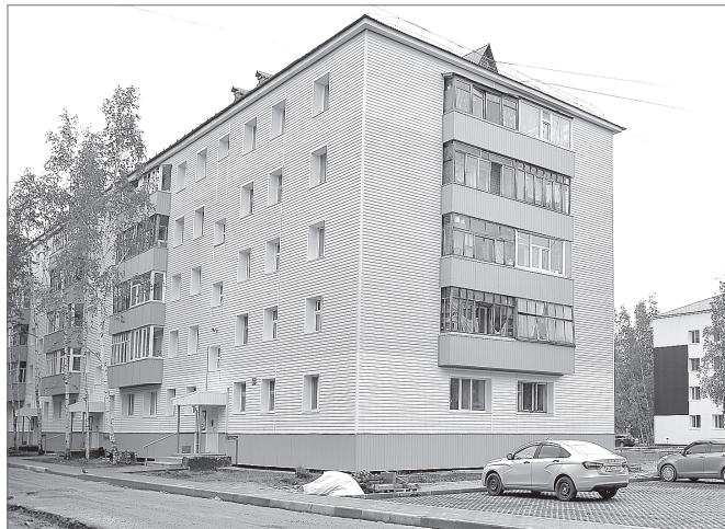
Фасад дома №22-а на улице Омской гармонично вписывается в новую придомовую территорию, отремонтированную в рамках Марафона благоустройства во втором микрорайоне.