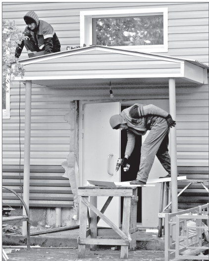
Дом №14-б на Комсомольском бульваре принарядился и утеплился.

Фасадные работы с утеплением в доме №14-б соответствуют техническим требованиям - к такому заключению, обойдя дом не один раз по кругу и осмотрев его изнутри и снаружи, пришли члены комиссии.