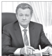
Василий Тихонов, глава города.

После многочисленных просьб о необходимости вернуть в расписание местного аэропорта вечерний перелёт в столицу России, поступивших в адрес главы Нижневартовска Василия Тихонова от жителей города, руководителю перевозчика было направлено соответствующее письмо. В результате его рассмотрения «Аэрофлот» принял решение увеличить количество рейсов между Нижневартовском и Москвой. В рамках осенне-зимнего расписания работы вартовчане смогут летать ежедневно в 17 часов 35 минут (прибытие в аэропорт «Шереметьево» - в 19 часов 5 минут, вылет в наш город из Москвы будет осуществляться в 11 часов, а прибытие в Нижневартовск - в 16 часов 25 минут).