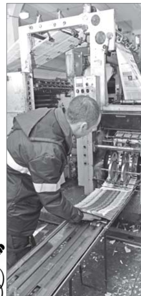
Свежий номер «Варты» - на выходе.

Сегодня «Варте» - 28 лет. Она красива, энергична и полна новых планов. Журналисты уже составляют планы на будущий год и готовы удивлять вас новыми интересными проектами. При этом они - всегда в гуще событий, у них всегда всё «горит», и они спешат поделиться с вами всем хорошим и прекрасным. Хочу пожелать всему коллективу, работающему над имиджем «Варты», вдохновения, творческих идей и насыщенной жизни. Чтобы каждое мгновение оставляло в душе только яркие воспоминания. И, конечно же, чтобы перо всегда было острым, правдивым и внушало доверие. Нашему молодому коллективу есть у кого учиться. Это журналисты с многолетним опытом работы, в копилке которых - награды самого разного достоинства, в записных книжках - истории целых поколений нижевартовцев. На них равняются молодые, с их мнением считаются руководители самых разных структур, с ними советуются читатели, поскольку за долгие годы работы они завоевали самое главное - уважение и точно знают формулу доверия.