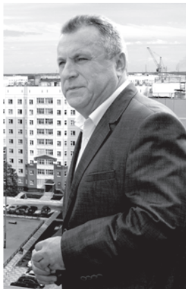
С наилучшими пожеланиями, коллектив ЗАО «НСД».

Неиссякаемой энергии, крепкого здоровья, счастья и семейного благополучия!