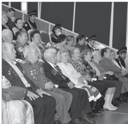
Почетные гости вечера, ветераны ВОВ.