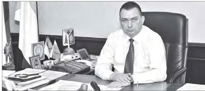
Максим Клец, глава города Нижневартовска:

— Это не плохо, что в нашем законодательстве появился такой документ. Конечно, работодателей, которые сегодня оказались в сложных экономических условиях, тоже можно понять. Но любые финансовые проблемы руководства не должны затрагивать интересы работников. Убеждён, что новый закон повысит эффективность защиты права работников на получение заработанных денег и стимулирует работодателей к своевременной выплате зарплаты под риском банкротства. При этом руководство будет само заинтересовано вести учёт задолженности перед персоналом. И здесь меня привлекла вот какая норма, заложенная в документ: если из-за недостаточности денежных средств организация будет иметь непогашенную в течение более чем трёх месяцев задолженность по выплате выходных пособий, оплате труда и другим причитающимся работникам выплатам, то руководитель организации будет обязан обратиться с заявлением должника в арбитражный суд. То есть сам сделать шаг к своему банкротству. А для любого серьёзного предпринимателя лучшим будет заплатить своим работникам и спокойно вести бизнес дальше.