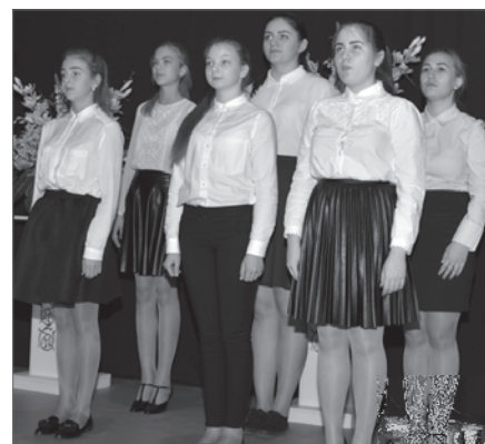
Студия художественного слова «Вертикаль».