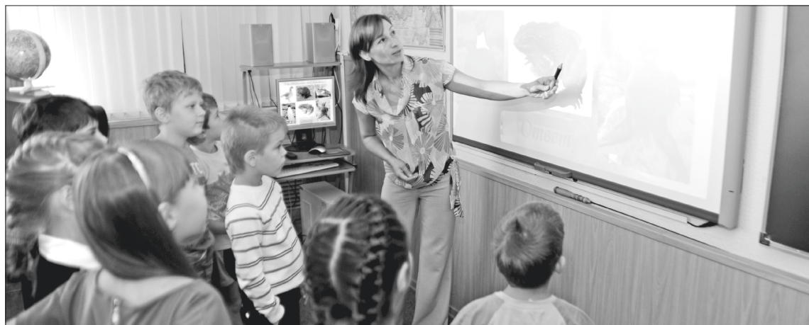
Если урок интересный, то можно подойти поближе (гимназия №1).

крывать новые классы, внедрять компьютерные технологии... Но уже на имеющейся базе наши дети получают знания, позволяющие большинству из них поступать в престижные российские вузы. На мой взгляд, образование сегодня переживает переходный период, поэтому и нынешний учитель — гибкий, умеющий приспосабливаться к новым методикам, к современному цифровому поколению детей. Не могу сказать, что сейчас быть учителем сложнее, думаю, это никогда не было легко. Однако в погоне за нововведениями в учебном процессе нужно ещё и успевать совершенствовать психолого-педагогическую составляющую профессии. Это сложно и тем более почётно и профессионально. Я всегда считал, что быть учителем — это прежде всего огромная ответственность. От педагога зависит, какими вырастут ребёнок, класс, поколение! И это не преувеличение. Это контроль за каждым своим словом и действием, это внимание всем и каждому в отдельности. Так учитель завоёвывает любовь своих учеников и уважение родителей. Но! Любой учитель ответит мне: «Оно того стоит!» — потому что ничто не сравнится с улыбками учеников, откровенной благодарностью любимому учителю. Быть учителем — это быть свидетелем рождения самого важного: крепкой дружбы, первой любви, детской радости. Желаю всем учителям удовлетворения от своей работы, крепкого, так необходимого сегодня, сибирского здоровья, послушных учеников и всеобщего понимания. Дарите детям знания, а родителям — отличников!