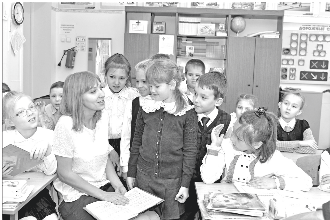
Самым живым примером для ученика является учитель (школа №29).