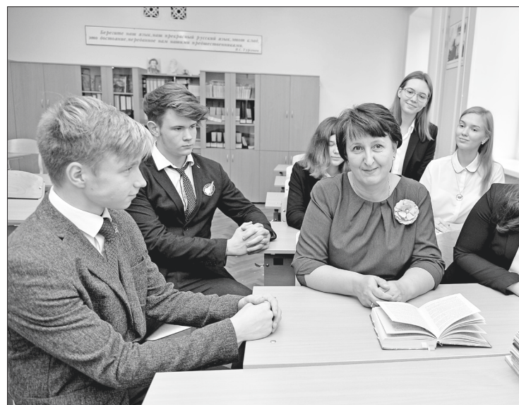
Открывая книгу, педагог открывает для ребёнка новый мир (лицей).

вышает свою квалификацию, стремясь соответствовать требованиям современности. В нашем городе для профессионального роста, комфортной и продуктивной работы с учениками созданы все условия. На высоком качественном уровне находятся и образовательный формат, и образовательная база в Нижневартовске. Доказательством этому являются и результаты сдачи ЕГЭ, и количество детей, которые ежегодно поступают в лучшие вузы страны. Желаю нашим учителям самых талантливых и одарённых учеников, терпения, профессиональных и личностных успехов, света и добра!