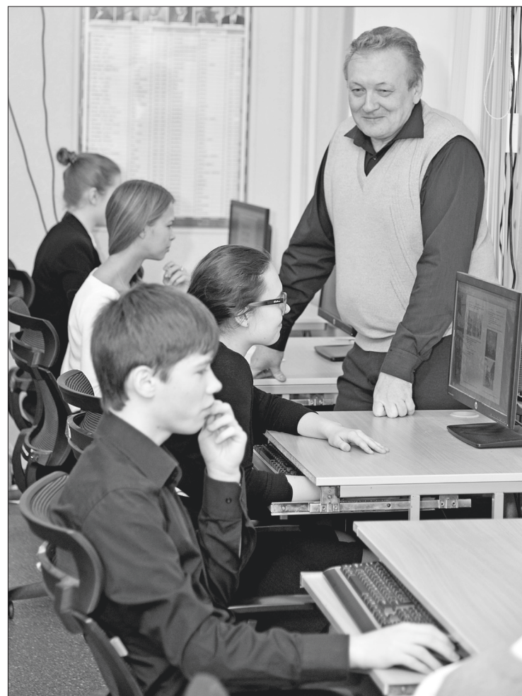
С таким преподавателем будешь с компьютером на «ты» (школа №2-многопрофильная им. Е.И. Куропаткина).

новшествами в оснащении образовательной базы. Нижневартовск не исключение. Все эти факторы вместе помогают нашим детям добиваться высоких результатов. Это подтверждают и итоги единого государственного экзамена, в Югре мы по этому показателю одни из лидеров. Для выпускников школ нашего города открыты двери лучших вузов страны. И, конечно, как патриоту своего города, хотелось бы, чтобы бывшие нижневартовские школьники, получив высшее или среднее профессиональное образование, возвращались на свою малую родину, внося и свой вклад в её развитие. Так, моя дочь училась в Томском государственном медицинском университете, теперь трудится в Нижневартовске, сын получил высшее образование в нашем городе, остался в родных краях. Так что, знаю не понаслышке, что образование в нашем городе находится на высоком уровне. А в этот замечательный праздник учителям желаю благодарных учеников, которые будут впитывать знания, радовать своими успехами и достижениями!