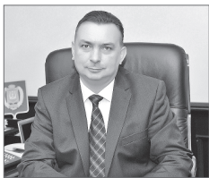
Максим Клец, глава города Нижневартовска:

- Существованием «Самотлорских ночей» мы обязаны нашим ветеранам, которые сегодня присутствуют и на сцене, и на трибунах. Они первыми нашли здесь нефть и с нуля построили для нас современный, комфортный для проживания город. Давайте скажем им «спасибо» за их труд, силу духа и мужество. Это праздник для каждого из нас, потому что мы любим нашу малую родину, всеми силами помогая городу расти и развиваться.