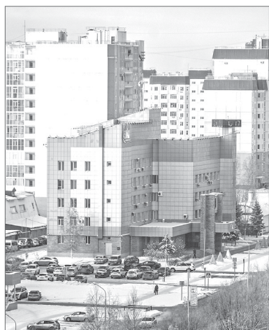
Департамент строительства администрации г. Нижневартовска.

Ознакомиться с новой редакцией Генерального плана можно на официальном сайте органов местного самоуправления города Нижневартовска («Документы» / «Документы Думы города» / «Решения Думы города»).