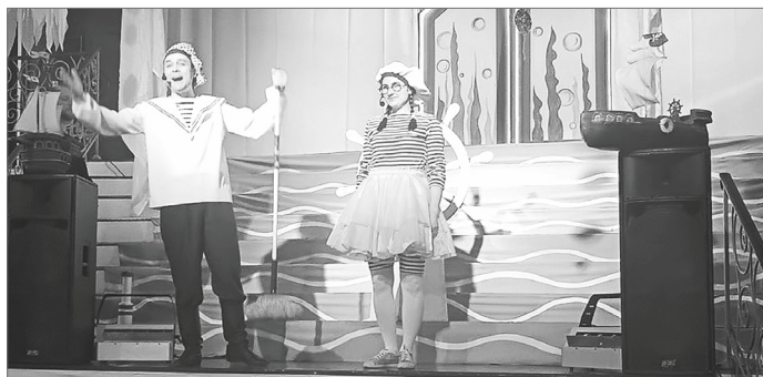
В Театре юного зрителя ребята ждали приключения в подводном царстве.

Заслужив улыбку на рошёнком личике, надеюсь на то, что не разочаровала новую знакомую.