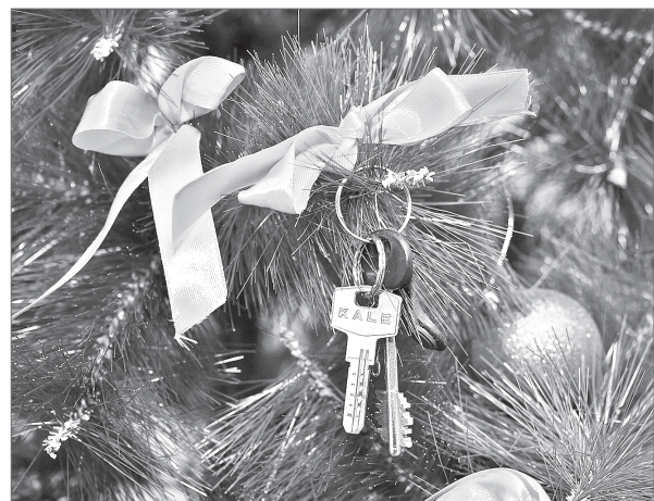
Новый год – в новой квартире! Для двух десятков городских семей Дед Мороз сделал главный подарок в их жизни.

– Муж долго не верил в происходящее, – улыбается многодетная мама. – Но жизнь доказала, что чудеса случаются, в нашем случае – прямо под Новый год.