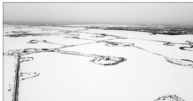
Самотлорское месторождение с высоты птичьего полёта.

Дарья Ткаченко. Фото предоставлены АО «Самотлорнефтегаз».