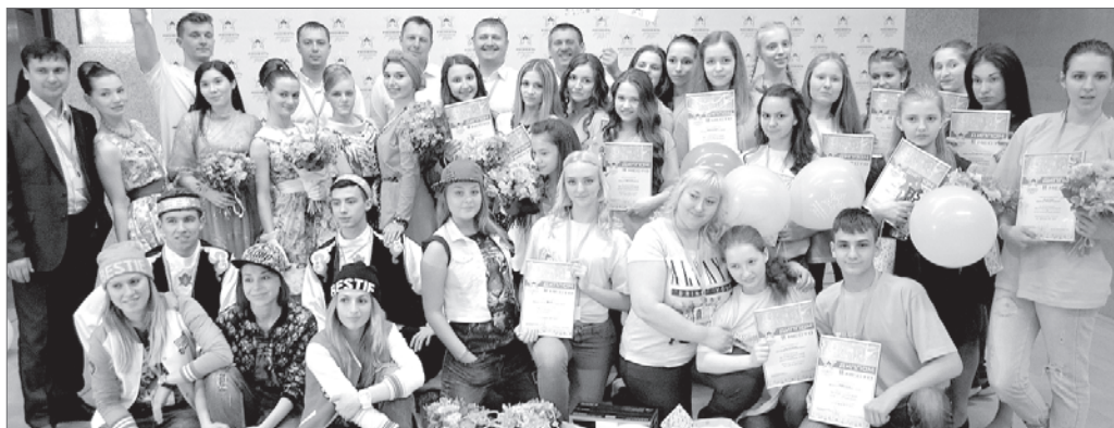
Сборная талантов ОАО «Самотлорнефтегаз».

По итогам отборочного тура, который проходил в Нижневартовске, в Москву отправились 50 человек, 43 из них - победители регионального этапа «Роснефть зажигает звёзды».