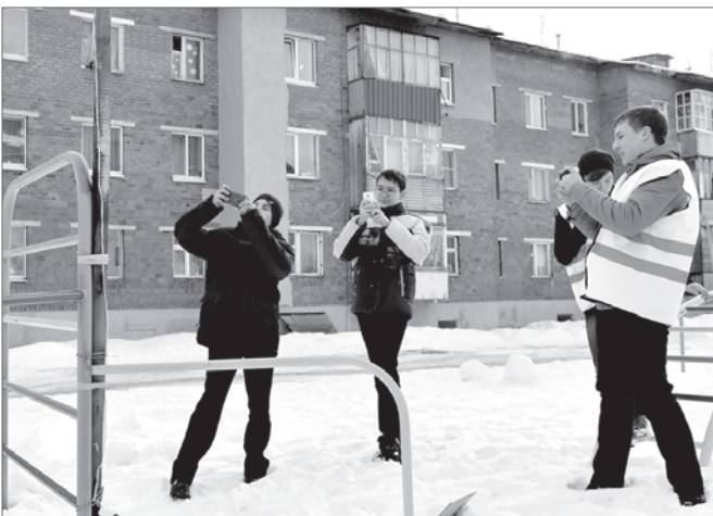
На фотопрогулке ребята становятся настоящими репортерами.

Внимательно изучив карту прилегающих к школе территорий, вооружившись телефонами и фотоаппаратами, старшеклассники отправляются на... фотопрогулку!