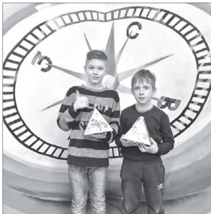
В клубе «Компас» всегда можно узнать что-то интересное.

В единый Всероссийский день правовой помощи детям 20 ноября 2018 года управлением по опеке и попечительству администрации Нижневартовска проводятся бесплатные юридические консультации для детей-сирот, детей, оставшихся без попечения родителей, а также их законных представителей, лиц, желающих принять на воспитание в свою семью ребёнка, оставшегося без попечения родителей, если они обращаются за оказанием бесплатной юридической помощи по вопросам, связанным с устройством ребёнка на воспитание в семью.