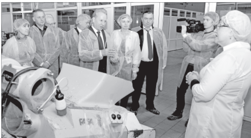
С этой установки началась развитие «Белой коровы».