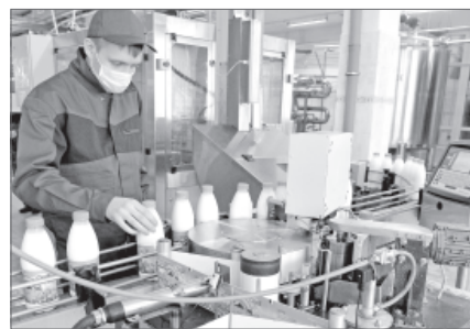
Многие технологические процессы автоматизированы.