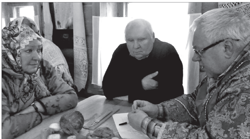
Вязание рыболовных сетей - скрупулезная, но увлекательная работа.

Краеведческий музей также организовал необычные и интересные мероприятия для своих посетителей.