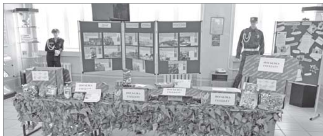
Акция «Посылка солдату» проходит повсеместно в детских садах и школах Нижневартовска.

сейчас это возродилось, может, под эгидой волонтерских движений, может, как-то ещё. Важно ведь не название. Некоторые из моих учеников проявляют инициативу, сами предлагают, где можно и нужно что-то сделать. Некоторых надо совсем немного подтолкнуть, направить, вдохновить своим примером. Но все они - добрые и отзывчивые ребята, работать с ними мне в радость.