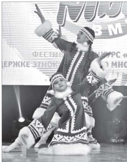
«Карусель» в северном исполнении.

Во Дворце искусств с успехом прошёл фестиваль-конкурс по поддержке этнокультурного многообразия «Мы - вместе!». Наряду с концертными номерами, народными песнями и поэтической творчеством его участники продемонстрировали мастерство рукоделия, подтверждая давно известную истину - красота спасёт мир.