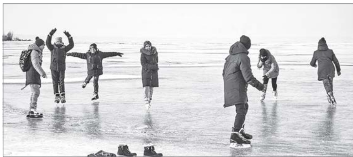
Любимым забавам пока не время.

Стремительное течение мутных вод Оби в районе Нижневартовска уже не видно под коркой льда.