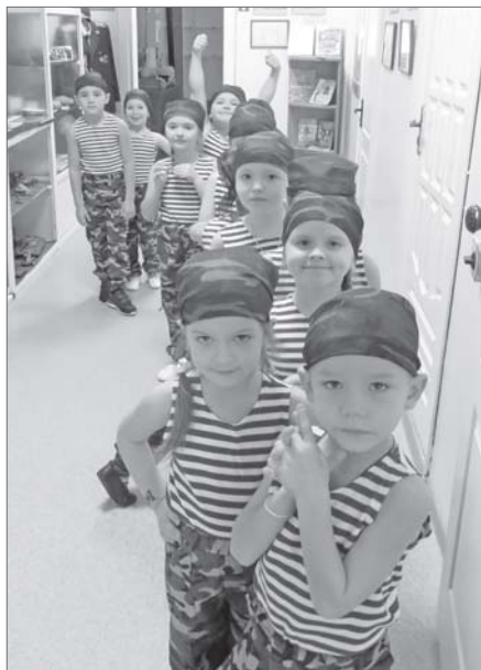
Отряд «Юный спецназовец» детского сада №31 «Медвежонок» всегда готов к добрым делам.

Не обязательно состоять в волонтерских отрядах, чтоб стать добровольцем, главное - стремиться к добру и взаимопомощи. Такие важные для всего общества и для каждого человека в отдельности стремления необходимо воспитывать с детства. Так считают в нижевартовских детских садах, где добровольцев готовят с детства. О том, как направить ребёнка по дороге добра, нам рассказали руководители детских садов.