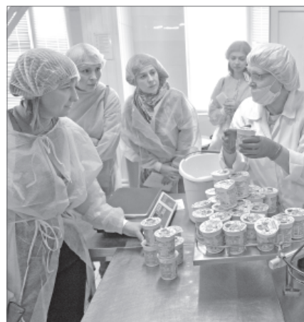
Вся продукция завода без консервантов.