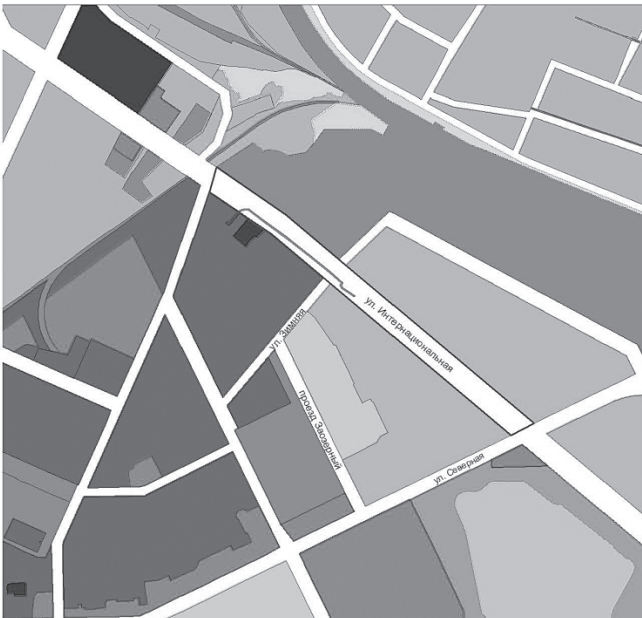
Схема границ проектируемой территории для размещения линейного объекта "Кабельная канализация от существующей ККС 10г-53 до здания по ул. Интернациональной, 24П" в системе улично-дорожной сети города Нижневартовска