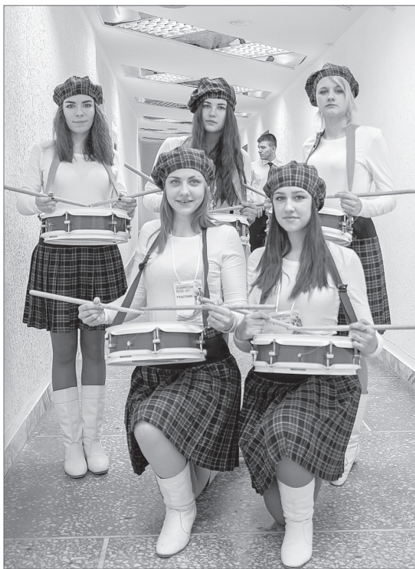
Политехнический колледж выступал под барабанную дробь.