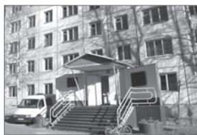
Музыкальная школа им. Ю.Д. Кузнецова.