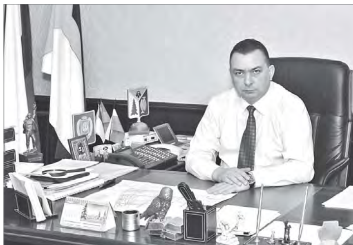
Максим Клец, глава города Нижневартовска:

- Проблема со своевременной оплатой населением коммунальных услуг существует по всей России. В Нижневартовске сумма просроченных платежей приближается к 700 млн рублей. Это огромные деньги, которые можно было бы направить на ремонт инженерных коммуникаций и благоустройство микрорайонов. Целенаправленную работу с должниками управляющие компании и городская власть ведут, не прекращая, последние семь-восемь лет. Методы «борь-